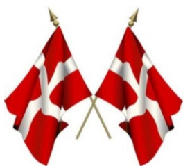
Lænken fylder 64 år.

Vores landsforening fylder 64 år, og i år fejres det på Sjælland på Rødovregaard i Rødovre.