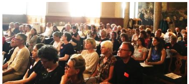
Konferencen i Fællessalen på Christiansborg