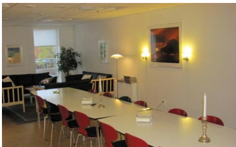
Amager Lænkens kaffestue

Som I har kunnet læse i bla. bladet Nyt fra Lænken maj 2018, er det nødvendigt at Landsforeningen og sekretariatet må spare grundet mangel på offentlige puljemidler.