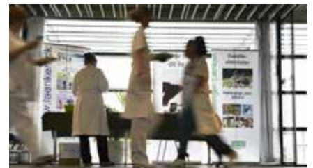
En Lænke-stand på et hospital i hovedstadsområdet i Uge 40.

Også andre steder i landet stillede Lænkens frivillige op i 2016 for at udbrede viden om alkoholproblemer og de lokale behandlingsmuligheder: i uge 40 på hospitaler og indkøbscentre, til kommunale sundheds- og frivillig arrangementer og på temamøder. Hertil kommer en lang række Åbent Hus-arrangementer i de lokale foreninger.