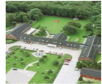
Laugesens Have som Landsforeningen ofte benytter til højskoleophold.

Et medlemskab koster blot 50 kr. pr. måned. Er du pårørende, familie, ven og/eller kollega kan du også være medlem.