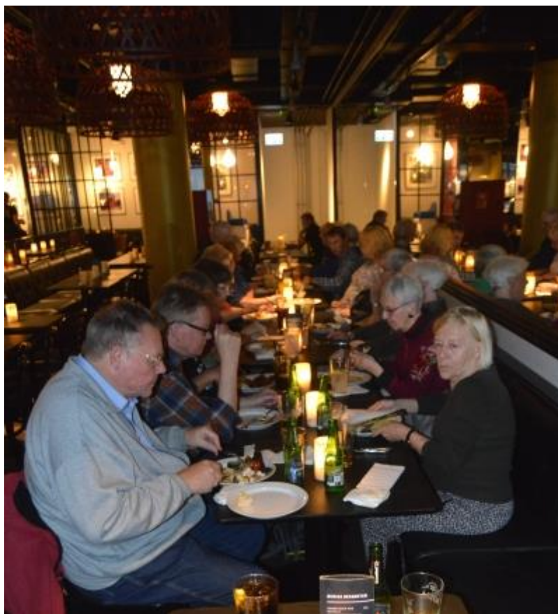
Efter rundvisningen tog vi til Dalle Valle i Fiolstræde og nød deres store buffet.