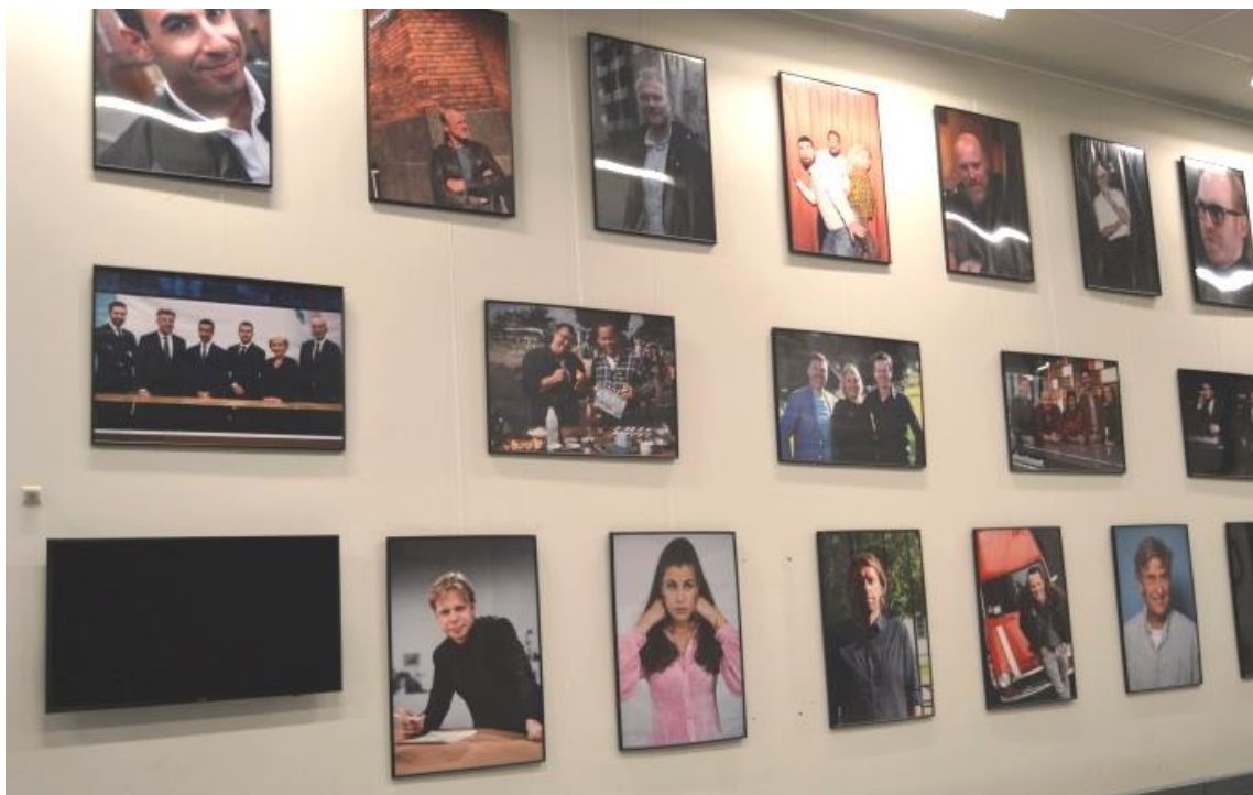
Rundt om i DR-bygningen hænger mange foto. Her er det i bygningen med studier, værksteder mm., hvor man kan se mange af de kendte ansigter fra DR.