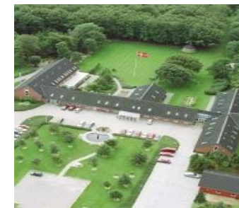
Laugesens Have som Landsforeningen ofte benytter til højskoleophold.

Et medlemskab koster blot 50 kr. pr. måned. Er du pårørende, familie, ven og/eller kollega kan du også være medlem.